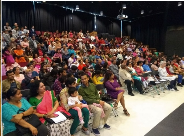
In een overvol theater Stefanus een geweldige gebeurtenis, met muziek en dans.