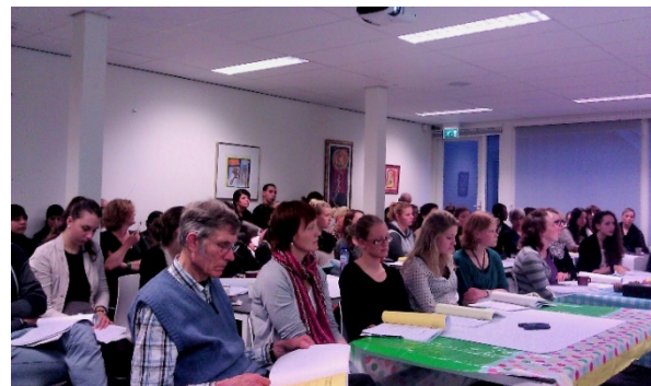
Training dialoogbegeleiders, studenten HU

De open formule - je kon deelnemen als organisator, dialoogbegeleider (na training) of deelnemer – bood ruimte aan ieders creativiteit of keuze. Onder de dialoogbegeleiders waren een dertigtal studenten van de Hogeschool Utrecht; het bleken echte talenten. De ervaring was voor hen zo bijzonder dat ze nog een keer 'op herhaling zijn geweest met een eigen thema. Vanaf 2015 komt er een einde aan het project als deel van het UPLR, en gaat men zelfstandig verder. Utrecht in Dialoog groeit verder door, en organiseert nu dialogen en trainingen het hele jaar door.