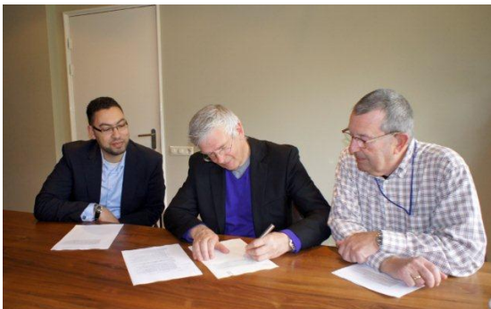
Ondertekening van de stichtingsakte

Op 21 april 2000 kwam het tot een eerste overleg. Twee kwesties kwamen steeds aan de orde: verbreding van het draagvlak en bezinning op doel en vorm. In een twaalftal bijeenkomsten groeide de kring van deelnemers, en ontstond er steeds meer diversiteit in vruchtbare samenwerking. Daarbij werd gebruikt gemaakt van de relevante delen van de Utrecht Monitor om een afspiegeling van alle stromingen binnen de stad te bereiken.